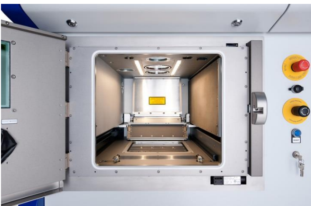
Camera di processo della SLM280 2.0 Selective Laser Melting Machine SLM Solutions Group AG

All'inizio della produzione, la camera di processo è inondata di argon. Tuttavia, finché i laser della stampante 3D lavorano, questa atmosfera cambia: si creano gas di fumo che mettono in pericolo condizioni ottimali sulla superficie del lavoro. Per garantire un perfetto processo di fusione, quindi, c'è una circolazione del gas protettivo e una compensazione costante, ma potrebbe potenzialmente portare ad un aumento