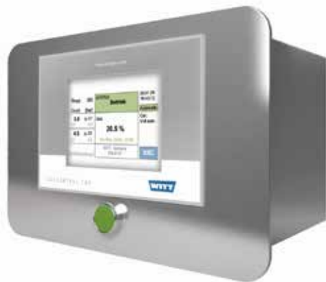
MAPY 4.0 als 19"-Einschubmodell zur Verwendung als Premium-Inline-Analysator

Je nach zu messenden Gasarten, also CO 2 , O 2 oder Helium, sind verschiedene Sensoren erhältlich. Das Produktprogramm beinhaltet chemische, paramagnetische, Infrarot- und thermische Leitfähigkeits-Messzellen. Ebenso ist eine äußerst langlebige Zirkonium-Messzelle für O 2 erhältlich, die sogar Messungen im ppm-Bereich ermöglicht. Hochwertige Einzelkomponenten und die robuste Edelstahlausführung garantieren eine lange Lebensdauer und erfüllen durch unkomplizierte Reinigung die hohen Hygiene-Anforderungen im Lebensmittelbereich. Eine Vielzahl an Anschlussmöglichkeiten (Ethernet, USB, Barcode-Leser, Drucker) gewährleisten die einfache Integration in die vorhandene Struktur. Die exportierten Daten können beispielsweise mit der WITT-Software GASCONTROL CENTER bearbeitet und ausgewertet werden.