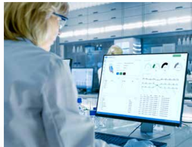
OBCC-Software zur Auswertung Ihrer Qualitätskontrollen