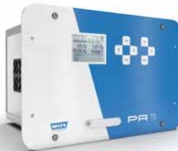
Auch als Einschubmodell erhältlich

Der PA verfügt über einen integrierten Messwertspeicher für die letzten 500 Messungen und ordnet die Messwerte verschiedenen Produktnamen zu. Über eine Schnittstelle können Messdaten einfach auf einen PC, zum Beispiel mit der WITT OBCC Software, übertragen werden.