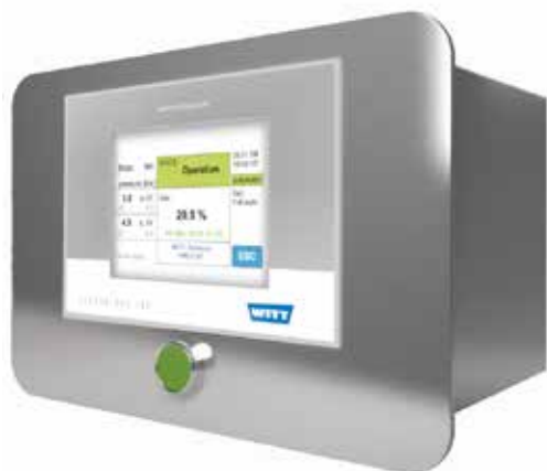
MAPY 4.0 en version rack 19" pour une utilisation comme analyseur en ligne premium

Des composants de haute qualité et le boîtier en acier inoxydable robuste garantissent la longévité de l'appareil et satisfont aux normes d'hygiène exigeantes de l'industrie agroalimentaire. différentes interfaces (Ethernet, USB, lecteur code-barre, imprimante) permettent une intégration facile dans des systèmes existants. Les données exportées peuvent être analysées et enregistrées avec le logiciel optionnel Witt Gas control center.