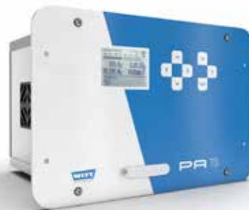
Également disponible en modèle enfichable

Le PA a une mémoire de 500 mesures, classées par nom de produit. Les résultats peuvent être transférés vers un PC pour édition et analyse, par ex. avec le logiciel WITT OBCC.