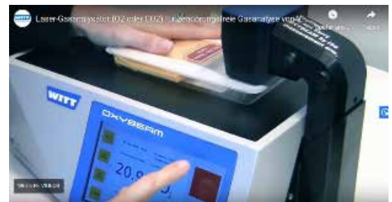
Vidéo de présentation sur wittgas.com ou sur la chaîne Youtube WITT